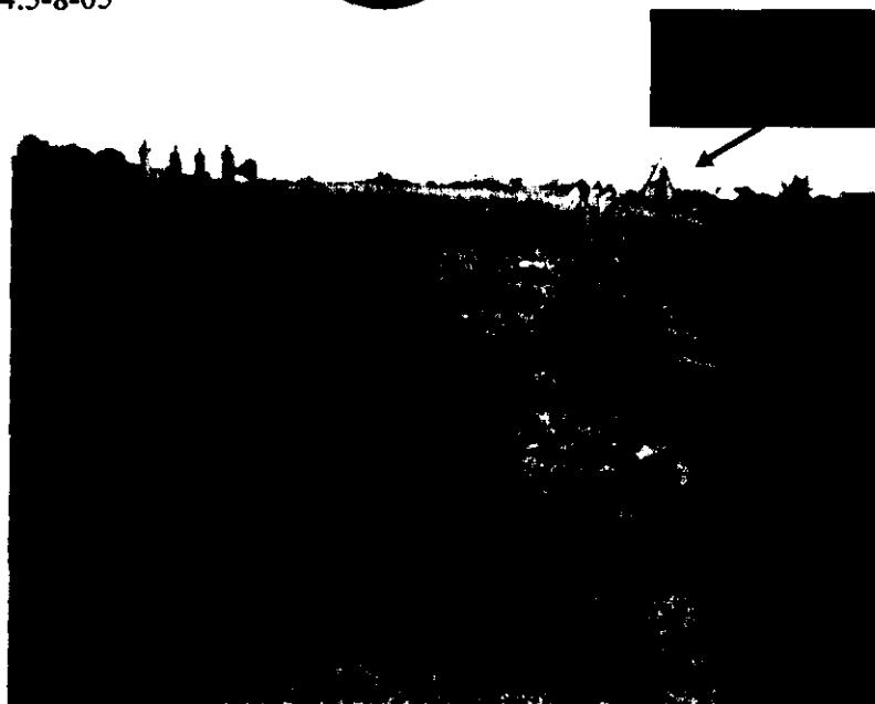
Marcas del tren principal izquierdo antes del inicio de pista durante la aproximación

Ya con este impacto antes de la pista toda la configuración del aterrizaje y la estabilidad de la maniobra es afectada descontrolando la aeronave para seguidamente producirse el impacto de las hélices con el terreno y todo el proceso de del accidente descrito en el numeral 1.12 hasta el detenimiento de la misma.