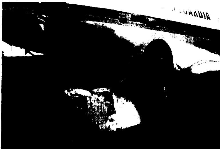
Estado final de la aeronave (Impacto de la hélice en el fuselaje izquierdo)

La aeronave sufrió daños estructurales y parada súbita de sus motores por impacto de la hélice con el terreno, desprendimiento de la hélice izquierda, daños estructurales en el fuselaje detrás de la cabina de pilotos, abolladuras en el plano izquierdo, desprendimiento del motor izquierdo y daños estructurales en los trenes principales de aterrizaje entre los principales daños.