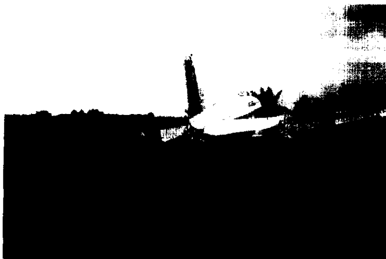
Vista posterior de la aeronave en el lugar del accidente

La aeronave sufrió daños estructurales y parada súbita de sus motores por impacto de la hélice con el terreno, desprendimiento de la hélice izquierda, daños estructurales en el fuselaje detrás de la cabina de pilotos, abolladuras en el plano izquierdo, desprendimiento del motor izquierdo y daños estructurales en los trenes principales de aterrizaje entre los principales daños.