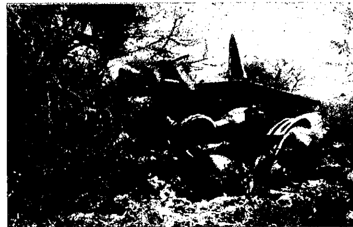
CONDICIÓN FINAL DE LA AERONAVE