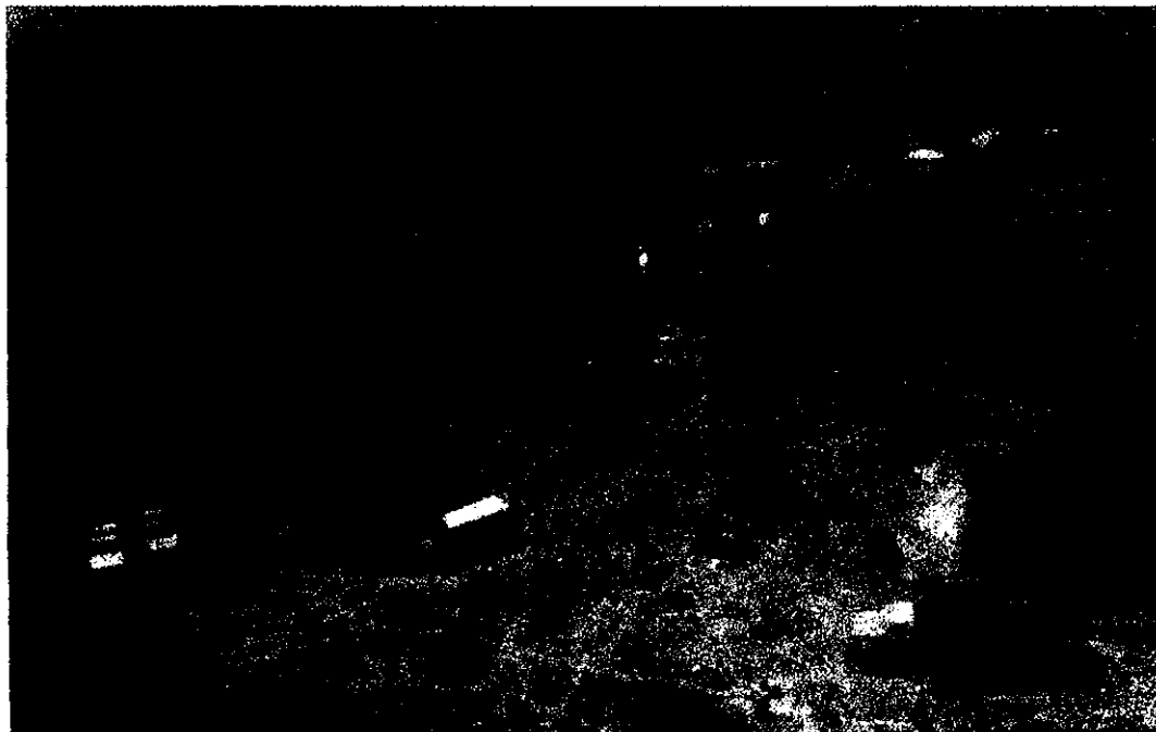
VISTA AEREA PARCIAL DE LA ZONA DE IMPACTO