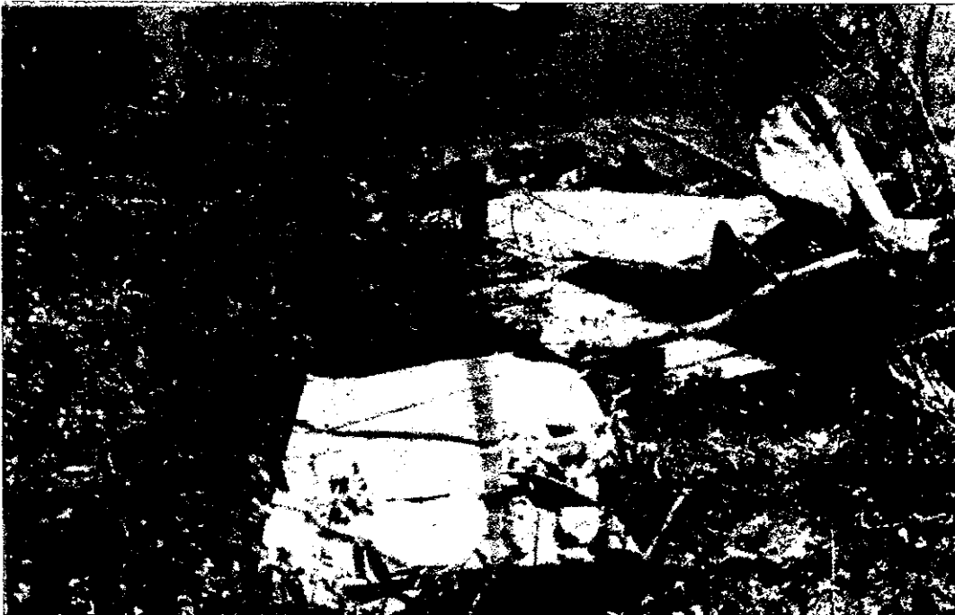
RESTOS ESPARCIDOS DE LA AERONAVE