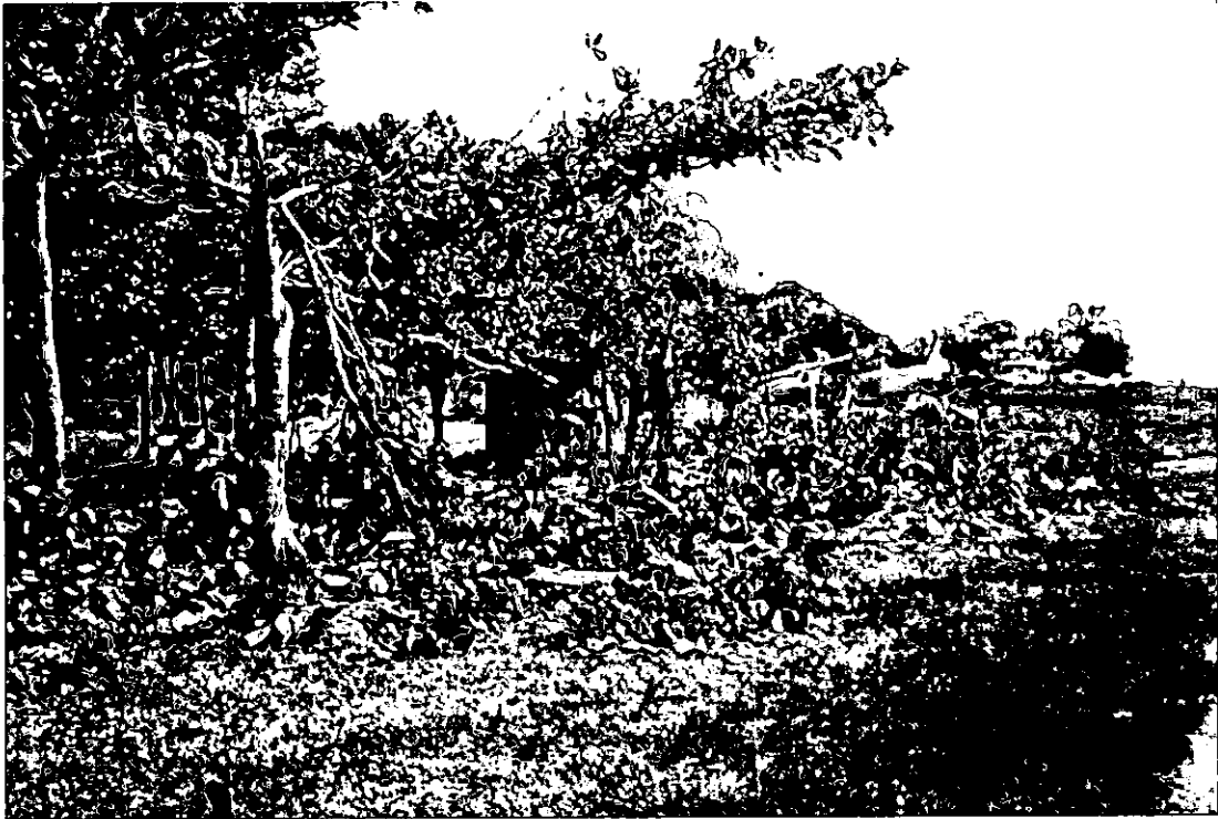
TRAYECTORIA - IMPACTO INICIAL